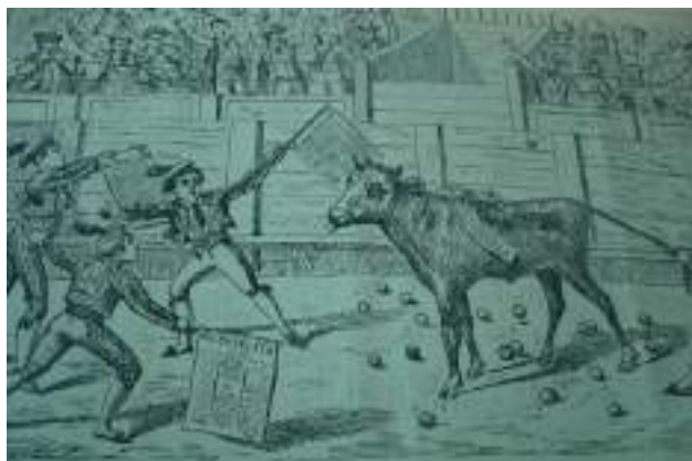
Ilustración 8. Caricatura de El Papelito que satiriza la aparición de El Cabecilla y a su propietario. —¡Fueeeera! Fueeeera! —¡Eso no es tooooooo! ¡Eso es un terneeeero! —¡Al corral! ¡Al corral!», El Papelito, 9-9-1882.