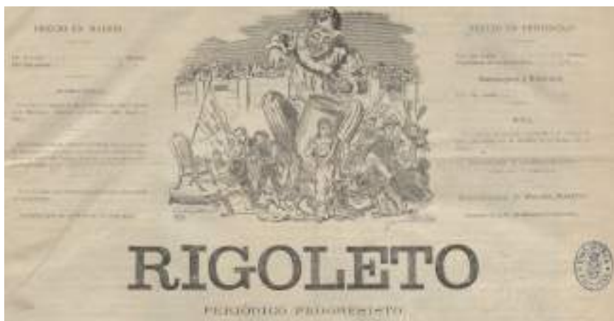
Ilustración 2. Macheta de Rigoletto , 1-1-1882. Biblioteca Nacional de España.