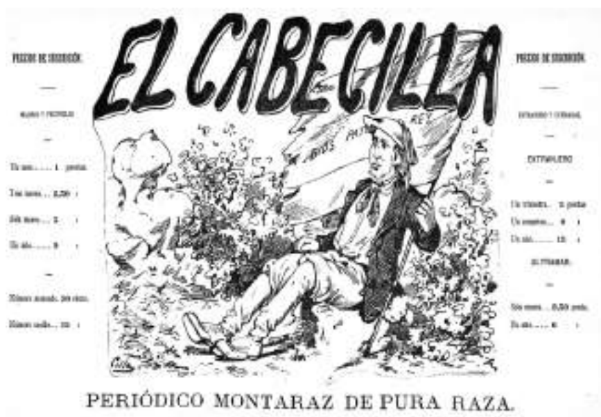
Ilustración 1. Macheta de El Cabecilla , 9-9-1882. Biblioteca Nacional de España.

El Cabecilla cesó en 1888; en realidad volvió a publicarse en noviembre de 1889 hasta su cierre definitivo al año siguiente. Javier Real Cuesta (1985, p. 28) señala que el barón de Sangarrén, destacado desafecto a las tesinas nocedalistas, fue su fundador y propietario, aunque esto no es completamente exacto: inicialmente no fue propietario, si bien años más tarde sí pasó a serlo. En las caricaturas de El Cabecilla , Sangarrén aparecía representado como adlátero del nocedalismo. No deja de ser sorprendente que Sangarrén hubiera sido el encargado de fundar la segunda época del satírico El Papelito , que se puso al servicio de la campaña de hostigamiento del nocedalismo contra los rebeldes que no aceptaban de buena gana el liderazgo de Cándido Nocedal. En realidad, el primer propietario fue Isidoro Ternero (1833-1899), antiguo diputado neocatólico implicado en varias intentonas insurreccionales carlistas, aunque lo fue por poco tiempo 5 . Los cambios en la silla pontificia con la llegada de León XIII (1810-1903) y la publicación de su encíclica Cum Multa (1882), junto al desprecio del rey-pretendiente condicionaron no solo su alejamiento de primera línea de la acción política tradicionalista —sin renunciar a mantener el pulso con los nocedalistas—, sino también su abandono de la Comunión en dirección al partido republicano progresista de Manuel Ruiz Zorrilla, amigo suyo desde la infancia (Higueras Castañeda, 2016) 6 .