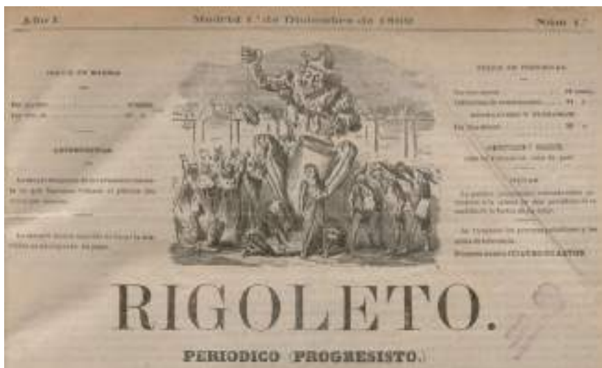
Ilustración 3. Macheta de Rigoletto, 1-12-1869. Biblioteca Virtual de Prensa Histórica.

canos eran identificados con el símbolo del gorro frigio en coalición con los progresistas de 1868 en la ilustración de 1882. La macheta apenas varió en los años siguientes, salvo por algunas modificaciones en su último año de existencia. En las gradas se distingue a un público que podría representar el apoyo popular con que contaba el carlismo.