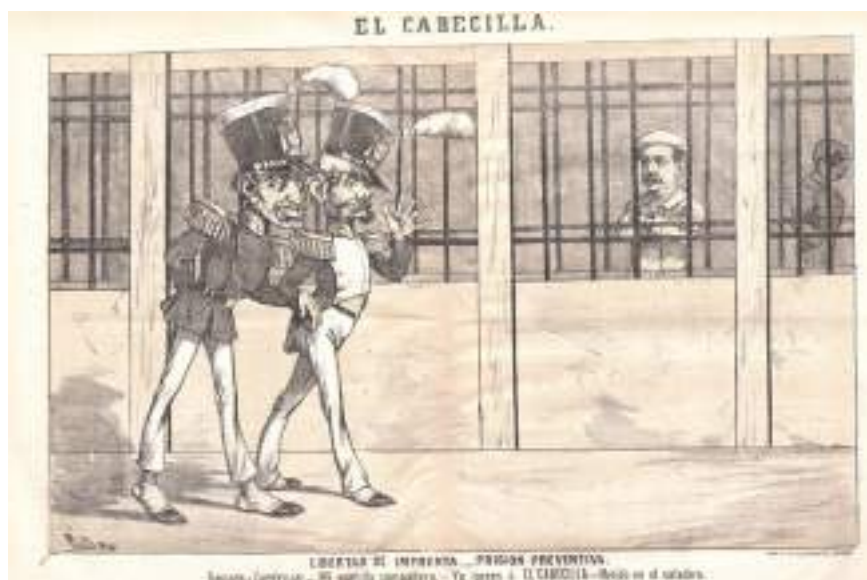
Ilustración 4. «Libertad de imprenta», El Cabecilla, 17-3-1883.

con el uniforme y chacó. Se trataba de estigmatizar su evolución política desde el progresismo al carlismo y de explotar sus amistades e influencias con liberales, conservadores y pidalinos, a quienes al mismo tiempo se combatía por igual desde las columnas de El Siglo Futuro . En Rigoletto también se dibujó al presidente liberal con este mismo uniforme.