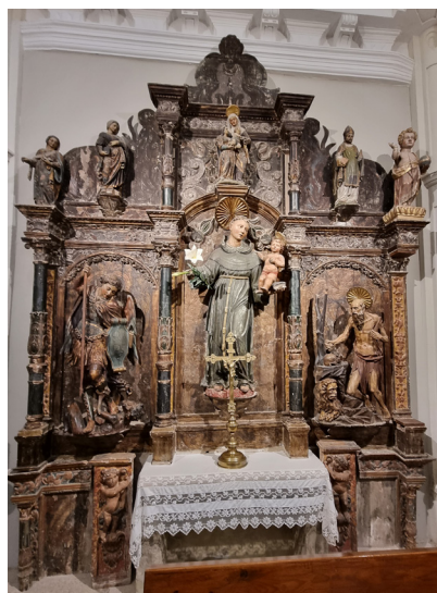
Fig. 2. Ortila, iglesia parroquial, antiguo retablo mayor de San Gil Abad (1537-1538), con la imagen principal de San Antonio de Padua (siglo XVIII).