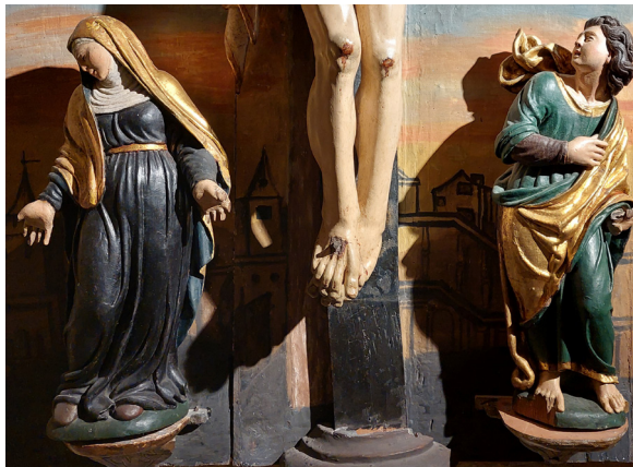
Fig. 12. Ortilla, iglesia parroquial, esculturas de la Virgen y San Juan del antiguo retablo mayor de San Gil Abad (1537-1538).