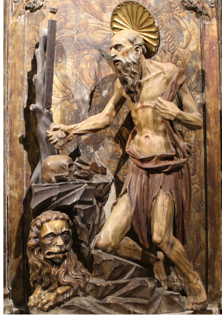
Fig. 8. Ortila, iglesia parroquial, San Jerónimo penitente, antiguo retablo mayor de San Gil Abad (1537-1538).