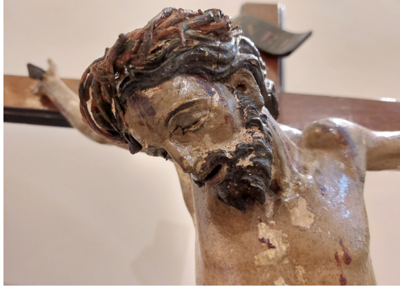
Fig. 11. Ortilla, iglesia parroquial, Cristo Crucificado (detalle), antiguo retablo mayor de San Gil Abad (1537-1538).