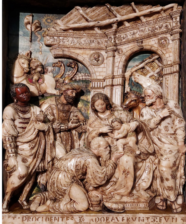
Fig. 3. Epifanía (alabastro policromado), Damián Forment. Huesca, Museo Diocesano.

2001) 14 . Las medidas de esos tres relieves de la Epifanía y las del bello relieve de alabastro, son básicamente iguales y cuando se hizo el molde se debió dañar el original y romperse la cabeza del jinete y parte del estandarte, que sí aparecen en una fotografía anterior a 1936 y en las tres copias citadas (Morte, 2022, pp. 228-229) 15