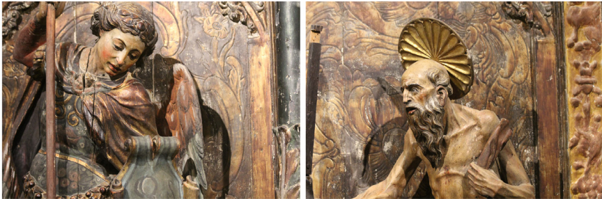
Fig. 4. Ortilla, iglesia parroquial, San Miguel Arcángel y San Jerónimo penitente (detalles), el fondo con decoración de hacia 1772, antiguo retablo mayor de San Gil Abad (1537-1538).

Estas labores son inapreciables hoy porque se repolicromó de manera burda hacia el último cuarto del siglo XVIII de acuerdo al gusto estético de la Ilustración, entonces se desecharon los esgrafiados y el oro solo se dejó en los nimbos. La nueva policromía se hizo con colores mates, predominando marrón, verde y azul, si bien el estado de la obra no permite apreciar bien todos los cambios. Se puso también una nueva decoración dieciochesca en el fondo de los paneles (debieron sustituir a las tres hornacinas originales del cuerpo del retablo) y el ornato renacentista se mantuvo en determinadas partes de la mazonería.