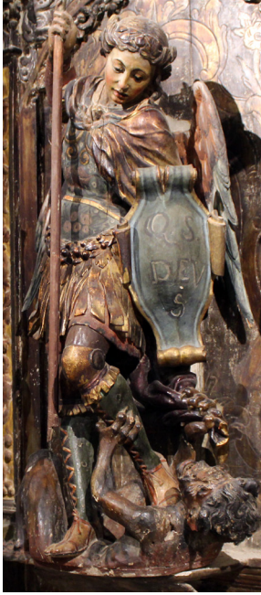
Fig. 7. Ortila, iglesia parroquial, San Miguel Arcángel lanceando al demonio, antiguo retablo mayor de San Gil Abad (1537-1538).

S(icut) Deus" (¿Quién es como Dios?), el significado original del nombre de Miguel guerrero dio lugar a esa frase latina. Fig. 7.