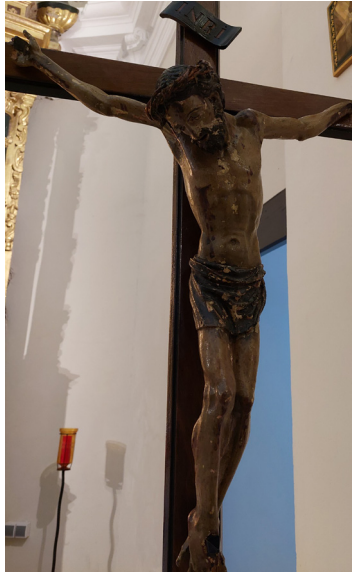
Fig. 6. Ortilla, iglesia parroquial, imagen de Cristo Crucificado, antiguo retablo mayor de San Gil Abad (1537-1538).