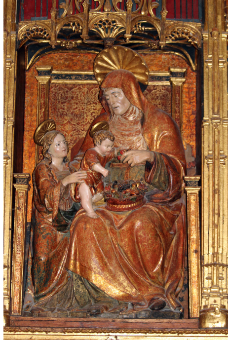
Fig. 10. Santa Ana, la Virgen y el Niño (madera policromada), ¿Miguel Peñaranda?. Jaca, Catedral.

en la iglesia del entonces monasterio de Santa Engracia de Zaragoza (1517) (Morte, 2009, pp. 44-45, doc. 165).