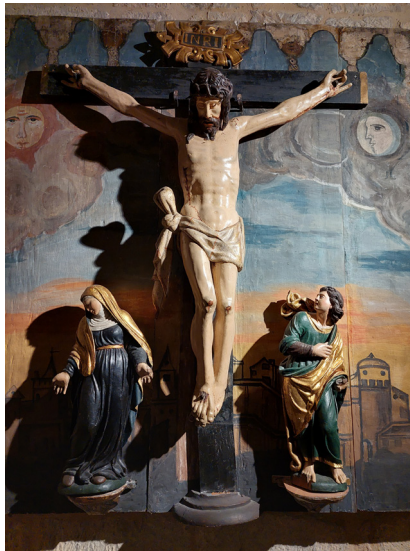
Fig. 5. Ortilla, iglesia parroquial, Calvario: esculturas de la Virgen y San Juan del antiguo retablo mayor de San Gil Abad (1537-1538), imagen del Crucificado del siglo XVII.

Finalmente, se precisa que en el ático debía estar el grupo escultórico del Crucificado con la Virgen y San Juan. Estas dos últimas imágenes se localizan hoy en la primera capilla del lado del Evangelio formando parte de un Calvario con la escultura de Cristo del siglo XVII y todo sobre un tosco fondo pintado 20 . Fig. 5. Mientras que el Crucificado de 1537, muy deteriorado, está clavado en una cruz moderna y se ha puesto en el presbiterio. Fig. 6. Las dimensiones de la Virgen y de San Juan Evangelista indican que la imagen de Cristo pertenece a ese grupo que estaba en el ático y no debe ser la escultura que debía acompañar a San Jerónimo penitente.