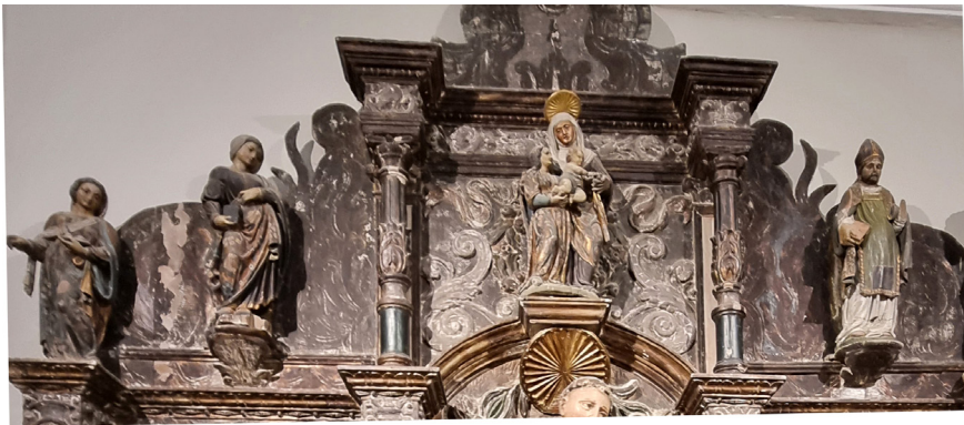
Fig. 9. Ortila, iglesia parroquial, Santa Lucía, Santa Engracia, Santa Ana Triple y San Nicasio, antiguo retablo mayor de San Gil Abad (1537-1538).

era diferente. El grupo trinitario de Santa Ana, la Virgen y el Niño (colocado en el centro), tuvo un notable éxito y obedece tanto a los patronazgos que asumió al ser relacionado con cualquier tema vinculado con la maternidad en edades avanzadas y en situaciones de previa esterilidad, como a las invocaciones para conseguir una buena muerte. De ahí el dicho popular “Santa Ana, buena muerte y poca cama”. Los orígenes del culto a esta santa, madre de María, son orientales. Santa Ana no es mencionada en los evangelios canónicos, sino en los textos apócrifos, y es a partir del siglo XIII cuando sus representaciones comienzan a ser más frecuentes, coincidiendo con la referencia a su historia en la Leyenda Dorada de Jacopo della Voragine. En cualquier caso, su culto se extendió en el siglo XIV, creció su devoción, se fundaron cofradías y se erigieron altares y capillas en su honor. En Europa alcanzará su máximo esplendor en las postrimerías del siglo XV, a raíz de que Sixto IV, en 1480, incorpora su celebración al calendario romano. Fig. 9