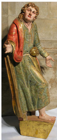
Lám. 3. San Juan Evangelista. Calvario del retablo mayor de la iglesia de San Vicente en Galilea.