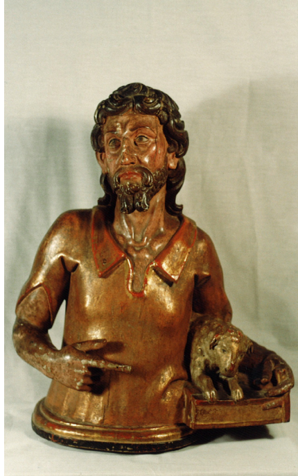
Lám. 12. Busto relicario de San Juan Bautista (Fotografía Inventario de Bienes de Patrimonio, 1996).

Colegial de Logroño tienen otras reliquias, no cabe duda de que hubo un error al hacer el inventario.