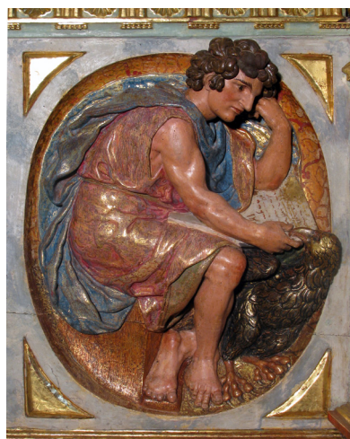
Lám. 4. San Juan Evangelista. Banco del retablo mayor de la iglesia de San Vicente en Galilea. (Fotografía de Mercedes Sierra Pallarés).