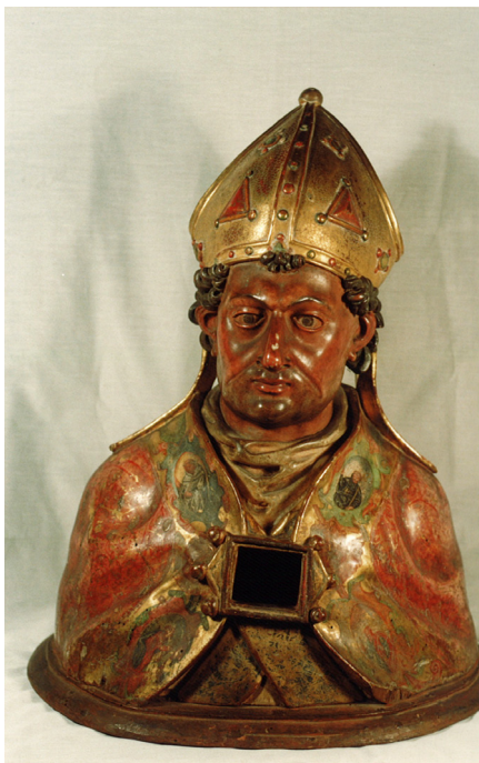
Lám. 10. Busto relicario de San Funes (Fotografía Inventario de Bienes de Patrimonio, 1996).

tenían la “cabeza de Funes en un busto de madera y bolsa de terciopelo” 23 . Posteriormente, en el inventario llevado a cabo el 20 de septiembre de 1835 afirman que el busto de San Funes estaba en la iglesia Colegial de la Redonda y el cráneo en su interior 24 (Lám. 10).