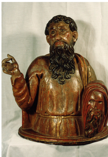
Lám. 11. Busto relicario de San Bartolomé.

y la mano en la talla sedente de San Gil para el retablo mayor de la iglesia homónima en Cervera del Río Alhama e, igualmente, en la representación de San Martín, revestido como obispo, en el retablo de la capilla que bajo su advocación se venera en la iglesia de San Cosme y San Damián en Arnedo, pudiendo haber portado estos dos últimos el báculo episcopal. En la mano izquierda, la talla de San Bartolomé sostiene su propia piel, arrancada en el tormento al que fue sometido (Vorágine, 1982, vol. 2, pp. 523-531) y en la que reproduce los mismos rasgos que vemos en el rostro del busto, con larga barba de grandes rizos y partida en dos. La cara tiene marcados pómulos, así como el entrecejo que frunce sobre la nariz, la boca está entreabierta y podemos ver los dientes; su mirada se dirige al frente, hacia el espectador. El cuerpo lo dotó de cierto volumen que, más adelante, Antonio de Zárraga irá perdiendo en otros trabajos. En la parte posterior de la talla hay una tapa que puede abrirse, comprobando que el busto es hueco y en su interior conserva como reliquias dos pequeños huesos (Lám. 11).