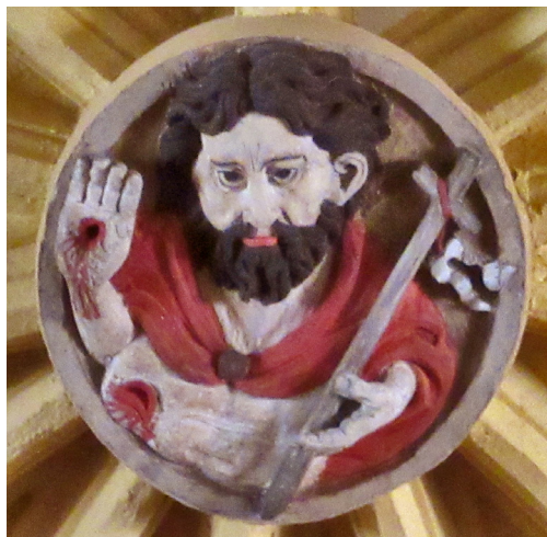
Lám. 7. Cristo resucitado en la clave central en la bóveda de la capilla mayor, en la iglesia parroquial de San Adrián y Santa Natalia en Autol.