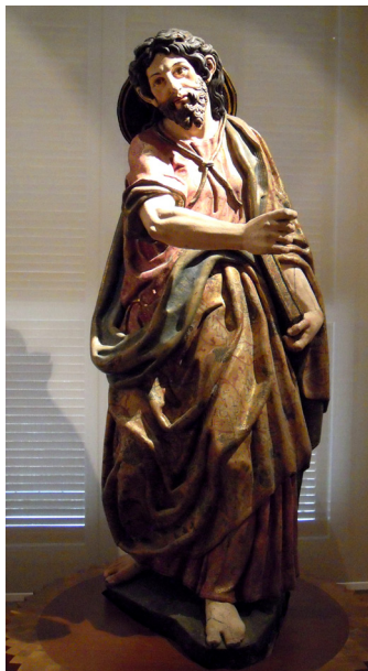
Lám. 1. Santiago el Mayor de Pedro de Arbulo. Retablo del monasterio de la Estrella en San Asensio (Museo de La Rioja).