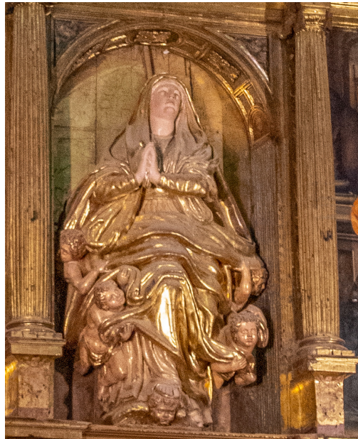
Lám. 6. Asunción en el retablo mayor del monasterio de Santa María la Real en Fitero.