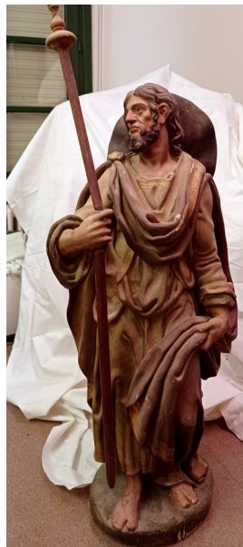
Lám. 2. Santiago el Mayor de Antonio de Zárraga. Iglesia de Cosme y San Damián en Arnedo.