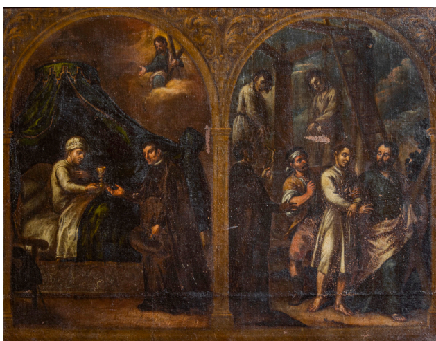
Fig. 21. Milagro de San Andrés. Óleo sobre lienzo en la iglesia de San Andrés de Calahorra.