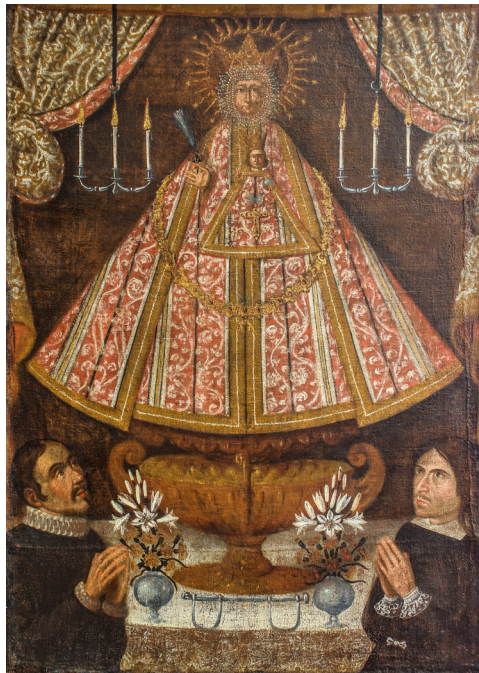
Fig. 19. Un preso de Sajazarra da gracias a la Virgen de Vico por su liberación. Obsérvese el cepo a los pies de la imagen de la Virgen. Arnedo, monasterio de Vico, 1673.