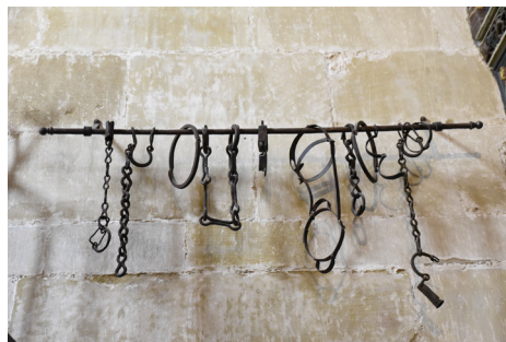
Fig. 26. Exvotos simbólicos colgados junto al gallinero con el gallo y la gallina en la catedral de Santo Domingo de la Calzada.

Es un bonito ejemplo de exvoto pictórico. Como exvotos simbólicos tendríamos que catalogar las cadenas, grilletes, cepos, cinturones de castidad y otros hierros que cuelgan de una barra colocada junto al gallinero donde viven el gallo y la gallina blancos dentro de la catedral de Santo Domingo de la Calzada (fig. 26). El templo más querido por nuestro homenajeado Tomás Ramírez Pascual.