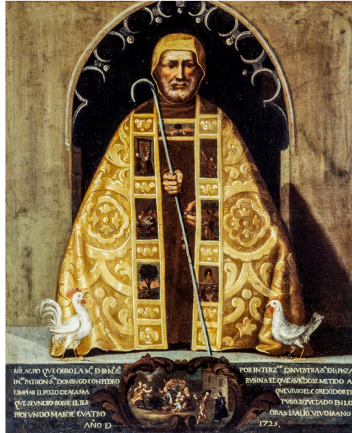
Fig. 25. Exvoto pictórico a Santo Domingo de la Calzada. Catedral del Salvador, 1725.

el pozo de la casa que vivió el corregidor, se hundió sobre él y estuvo sepultado en lo profundo más de cuatro horas y salió vivo y sano. Año de 1725”.