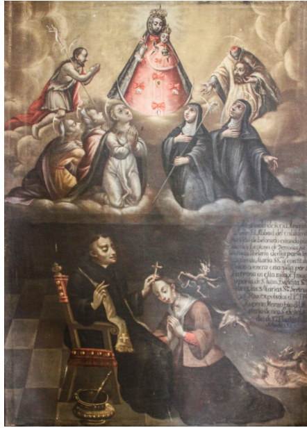
Fig. 10. Un monje del monasterio de Valvanera realizando un exorcismo. Ermita de Belén, Belorado (Burgos), 1721.