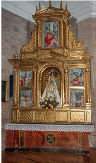
Fig. 14. Retablo de la Virgen en la iglesia de Ventosa. La leyenda del saqueo de Ventosa plasmada en escultura. Siglo XVII.

Escena segunda. Tabla inferior derecha. Cuatro soldados armados con espadas y lanzas van a rematar a un hombre que permanece tendido en el suelo.