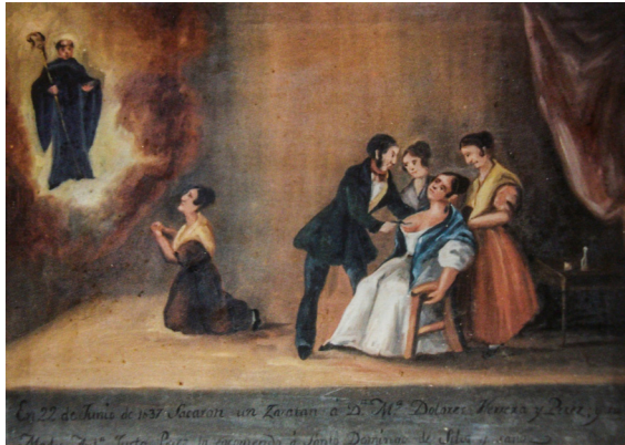
Fig. 7. Un cirujano operando un tumor en el pecho de una mujer en Laguna de Cameros, ermita de Santo Domingo de Silos, 1837.