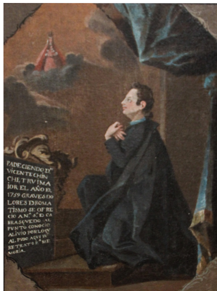
Fig. 8. Graves dolores de reumatismo han dañado las manos del enfermo. Grañón, ermita de Carrasquedo, 1759.

Mención especial hay que hacer de dos exvotos que informan de exorcismos. En uno de ellos conservado en la ermita de Lomos de Orio (Villoslada de Cameros) vemos a una persona elegantemente vestida y peinada arrodillada ante la Virgen y arrojando un gran sapo por la boca (fig. 9). La leyenda, enmarcada en una orla, dice así: