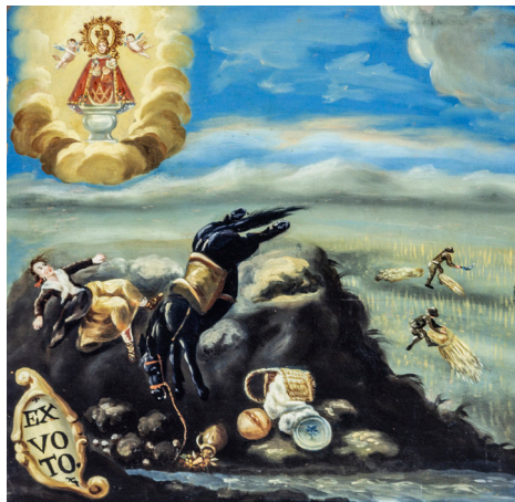
Fig. 6. El caballo sobre el que la muchacha llevaba la comida a los segadores (posiblemente gallegos, por su indumentaria) se ha encabritado por una repentina tormenta. En el suelo la cesta de mimbre que contenía el mantel, la hogaza de pan, la fuente de cerámica de Talavera y el puchero con el cocido. Ermita del Villar, Pradillo.

Los exvotos no sólo son pintura religiosa, son documentos que nacen del pueblo y son una fuente, en algunos casos única, para el conocimiento de la cultura material. El valor histórico y antropológico de la pintura votiva se fundamenta en el hecho de que no siempre se puede contar con documentos nacidos de las clases más humildes para conocer e interpretar la historia. El campesino, el pastor, el mendigo, pocas veces encuentra un cronista que narre su vida y vicisitudes. La pobreza genera pocos documentos. Sin embargo, los archivos históricos están llenos de voluminosos protocolos notariales, con una rica y variada información de las clases pudientes que puede ser consultada cómodamente por los investigadores. Por eso insistimos en el valor de los exvotos pintados como fuente importantísima para la historia. Es evidente, además, que determinados aspectos de la cultura popular y rural poco o nada han interesado a los investigadores y, consecuentemente, tenemos amplias lagunas de conocimientos. Es posible, por paradójico que parezca, que lleguemos a conocer mejor la casa de un terrateniente romano (por la arqueología y por los textos) que la casa de un campesino riojano de los siglos XVIII o XIX. Los exvotos, pintados por manos anónimas, nos indican cómo eran la arquitectura rural, el urbanismo, el mobiliario, el ajuar, los medios de transporte, las fiestas, los toros como parte esencial de la fiesta, los oficios, las travesuras de los niños (fig. 6).