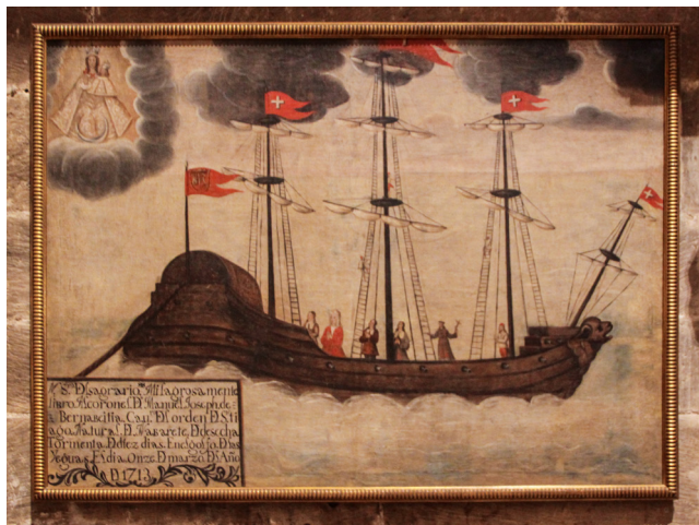
Fig. 4. Tres espacios pictóricos: arriba la imagen sagrada, en el centro la escena del milagro, abajo el texto informativo. Navarrete, Iglesia parroquial de la Asunción, 1713.

aparecer el nombre del donante, su localidad de residencia y la fecha. Cualquier información aportada otorgará un plus de fiabilidad al milagro así que, frecuentemente, los textos proporcionan muchos datos históricos.