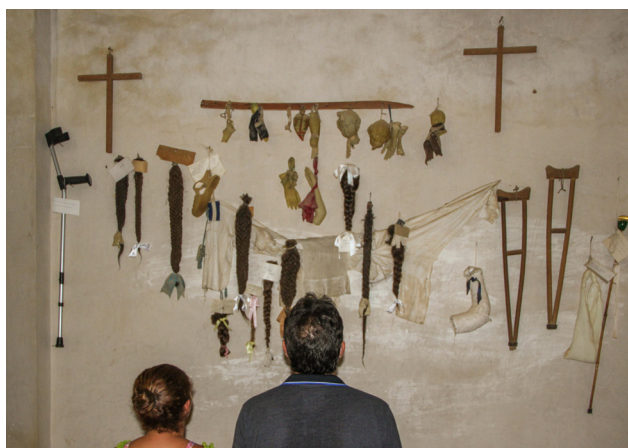
Fig. 5. Antes del Concilio Vaticano II, las paredes de las ermitas estaban cubiertas de todo tipo de objetos, exvotos y pinturas religiosas. Ermita de Santa Ana, Aldeanueva de Cameros.

y la forma de todas sus actividades. Para los protagonistas de aquel Concilio el concepto fundamental que emanó del Vaticano II es la purificación. Era urgente purificar la Iglesia y era necesario purificar los templos de la Iglesia. Así que comienzan a limpiarse y desnudarse las paredes de los santuarios que estaban colapsadas de todo tipo de pinturas y objetos acumulados a lo largo de los siglos (fig. 5). Es en este contexto en el que van a desaparecer muchos de los exvotos simbólicos. Los pictóricos van a resistir y muchos se van a salvar porque aquellas ingenuas pinturas van a ser consideradas, además de testimonios de fe, como un tipo de arte menor merecedor de ser conservado. Así podemos entender que se hayan salvado tantos exvotos pictóricos en La Rioja. Solo el descuido, el inexorable paso del tiempo y, a veces, su venta a anticuarios, ha hecho que algunos se hayan perdido. En esta zona, seguramente, también influyó la calidad pictórica de los exvotos. Algunos procedían de talleres de afamados pintores y en el caso de los lienzos sin autoría conocida, es evidente que aquellos pintores anónimos conocían bastante bien su oficio.