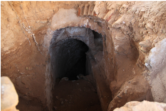
Fig. 22. Entrada a la bodega en el yacimiento arqueológico de la Noguera, en Tudelilla. Según la leyenda de San Andrés, en el año 1247 era una prisión de la ciudad de Calahorra.