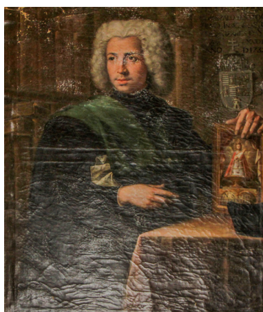
Fig. 12. Retrato pintado por Luis González Velázquez, uno de los más famosos pintores de Madrid de mediados del siglo XVIII. Iglesia de San Andrés, Valgañón.