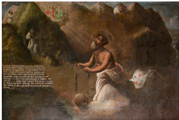
Fig. 16. Exvoto ofrecido a San Juan de Mata, fundador de la orden de los Trinitarios procedente de la ermita de San Juan. Iglesia parroquial de Canales.