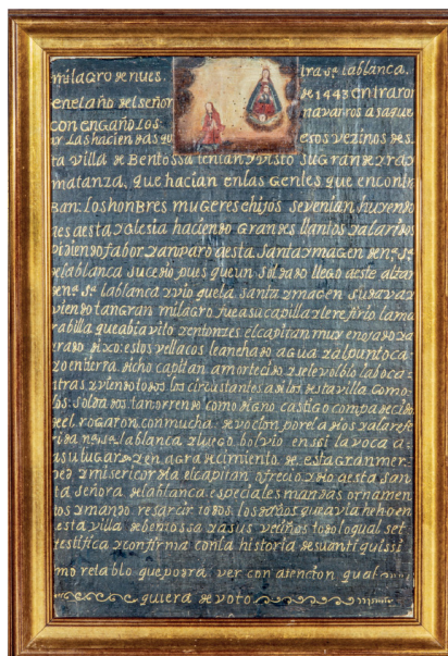
Fig. 13. Leyenda del saqueo de Ventosa por los navarros. Iglesia parroquial de San Saturnino. Óleo sobre tabla.