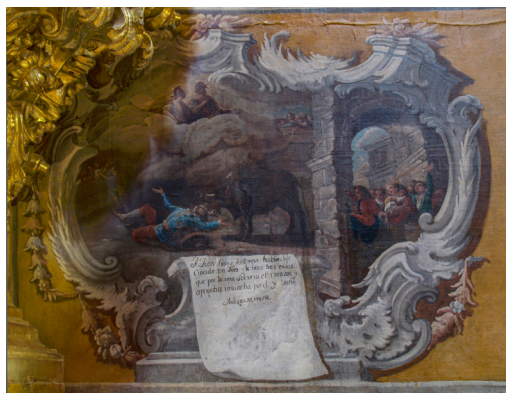
Fig. 11. Uno de los 8 exvotos pintados por el gran pintor barroco José Vejés en la capilla de los Mártires de la catedral de Calahorra. Sanación de una persona con tres heridas por sendas cornadas de un toro.

En Enciso hemos localizado dos exvotos con firma. En uno de ellos se lee “Petrus Domínguez fecit” y en el otro “Se pintó en Soria, por Callejo, año de 1819”. En Villanueva de Cameros, en uno de los exvotos de la ermita de los Nogales, se lee: “Madrid y mayo del año 1816, se pintó por Hidalgo”.