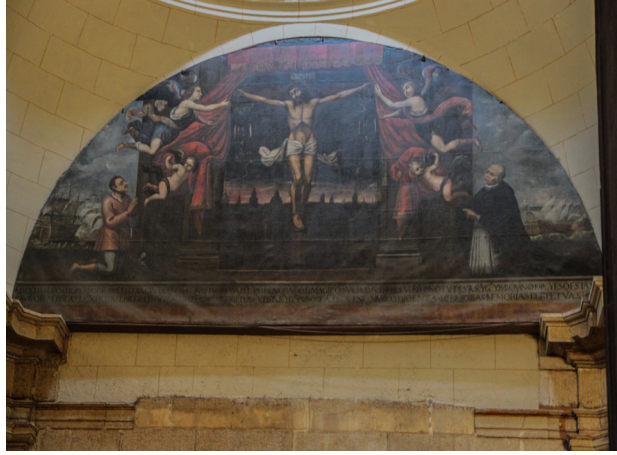
Fig. 18. El exvoto pictórico de mayores dimensiones de La Rioja se encuentra en Logroño en la Concatedral de Santa María de La Redonda. Se dan gracias al Cristo de los Labradores por la liberación del que fuera Canónigo de dicha iglesia, cautivo de los turcos en el año 1619.