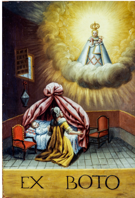
Fig. 2. Pradillo de Cameros, ermita del Villar, finales del siglo XVIII.

Podemos resumir la secuencia para la creación de un exvoto en los siguientes pasos: PEDIR – PROMETER – RECIBIR – DAR. Todas las culturas han desarrollado rituales pedagógicos para educar en la idea de la conveniencia de dar para poder recibir y de que las relaciones, para que sean recíprocas, tienen que tener correspondencia. Esto es así aunque la relación sea entre los seres humanos y sus dioses. De ahí el refrán nacido de la más honda sabiduría popular “es de bien nacidos ser agradecidos”.