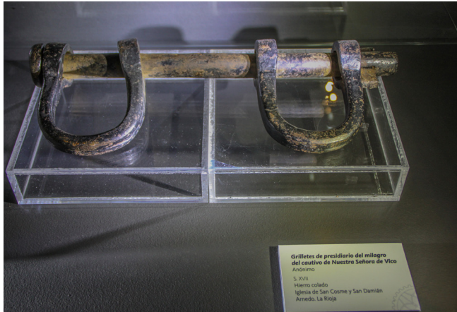
Fig. 20. En el monasterio de Vico se conserva como exvoto simbólico el cepo del cautivo de Sajazarra.

Referencias a otro cautivo encontramos en el monasterio arnedano de Vico. Un exvoto pictórico da fe del agradecimiento de un preso procedente de Sajazarra por haber sido liberado. En la pintura se observa el detalle del cepo que sujetaba los pies del cautivo (fig. 19). Un cepo semejante se conserva como exvoto simbólico en el mismo monasterio (fig. 20).