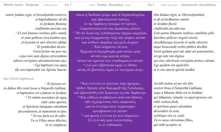
Fig. 2.b (Garcillegas, 2021).

Y otra sorpresa me llevó nada más fragmentarlo, porque sólo cuando lo escuché, comprobé que las pausas que hacen del relato en el ámbito helenófono de la liturgia bizantina, coinciden cabalmente. Sirvan, decíamos, los mismos versículos; se prescinde de toda nota al pie o al margen de la página; se suprimen las numeraciones innecesarias; prohibido recargarlo más o ‘deformarlo’ en eso que llaman hipertexto (es decir, contaminarlo con enlaces y vínculos informáticos); bastante ayuda (y falsa confianza filológica) aportan programas de rango universitario como Bible Works , o de alta