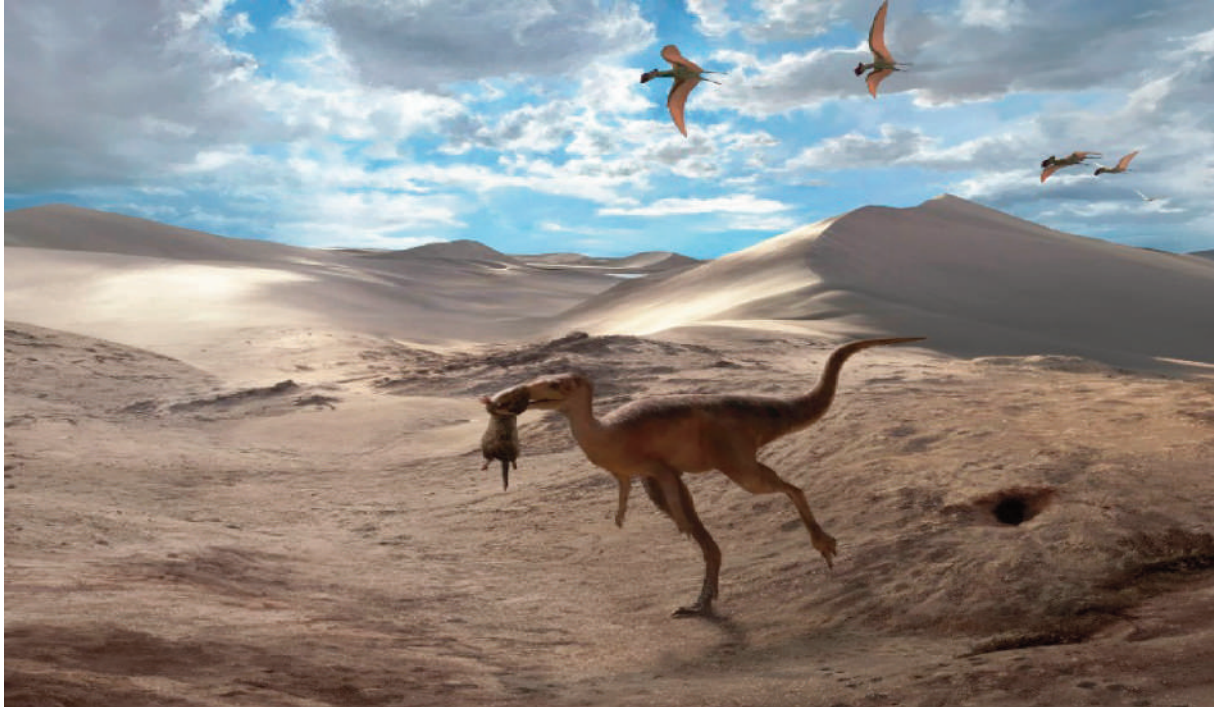
Figura 1 - O paleoerg Botucatu. Um trackmaker da pista Farlowichnus rapidus Leonardi et al. , 2024 encontrou uma presa, que é um trackmaker de Brasilichnium elusivum Leonardi, 1981, fora de sua toca imprudentemente. Arte por Guilherme Gehr