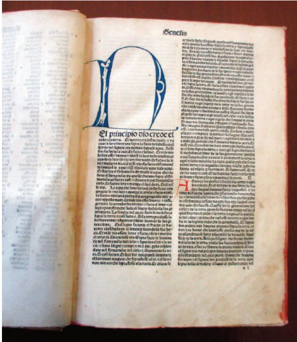
Figura 1. Incunabolo del 1481: La Bibbia tradotta in italiano da Nicolò Mallermi veneziano, e impresso nella tipografia di Ottaviano Scotto, a Venezia. Inizio del Genesi. Biblioteca dell'Istituto Cavanis di Venezia, di cui l'autore è bibliotecario

porte dei licei classici al pubblico e a promuovere, negli ambienti della scuola, spettacoli teatrali, mostre, concerti in lingua latina, o riguardanti questa lingua. In qualche caso, si organizzano anche degustazioni ispirate alla cucina e ai menù del mondo antico, con lo scopo di promuovere un ritorno agli studi classici (cf. Dionigi, 2025).