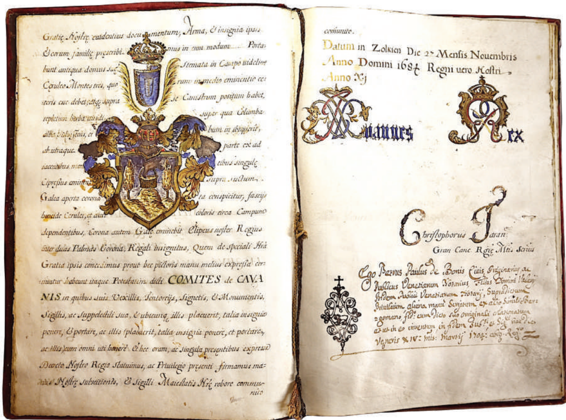
Figura 3 – Pagine di un diploma pergameneo in latino, firmato a Zolkten in Polonia, il 12 novembre 1684, dal re della Grande Polonia Jan III Sobieski (Copia conforme pergameneo del 1704, conservata nell'Archivio Storico dell'Istituto Cavanis a Venezia).

Nella confezione del glossario icnologico più recente (Lallensack, Leonardi e Falkingham, 2025), confesso che ci è invece sembrato più realistico, anche per un motivo pratico, limitarci alla sola lingua inglese. Del resto, per chi voglia imparare e/o comparare i termini nelle varie lingue, esiste sempre il glossario del 1987. D'altronde, quest'ultimo aveva il testo in inglese. Avevo spiegato nell'introduzione: "Fu scelto l'inglese come lingua per il testo, perché, purtroppo, non esiste una lingua neutra. L'inglese può essere compreso da tutti gli icnologi" (Leonardi, 1987, p. vii R).