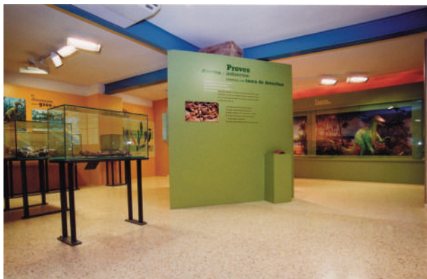
Figura 2: vista de l'antiga sala de paleontologia del Museu de la Conca Dellà amb fòssils en exposició dins de vitrines i la reconstrucció d'un hadrosaure al fons de la imatge.

els materials estan dipositats en un museu, i també seguint el mateix reglament, és el Departament de Cultura, seguint les disposicions de l'article 25 (Determinació del lloc de dipòsit definitiu), que ha de determinar el lloc de dipòsit definitiu, sempre vetllant per la millor conservació i accés d'aquestes col·leccions.