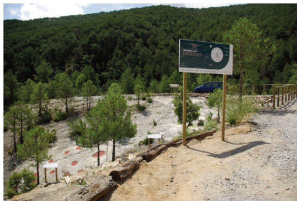
Figura 3: vista general de l'aflorament paleontològic del Mirador del Cretaci. En primer pla, i marcades en vermell, les marques de pas de sauròpodes. El recorregut començava en una zona amb impressions de fulles de Sabalites, continuava per la zona d'icnites de dinosaure, per acabar en una superfície on es podien observar diverses acumulacions amb ous de dinosaure.

Com a conseqüència del rebombori mediàtic i també d'una presa de consciència sobre la importància del patrimoni fòssil, es forma l'associació ADAU (Amics dels Dinosauris de l'Alt Urgell) on hi participen aficionats als fòssils, gent amb interès pel patrimoni i geòlegs locals. Aquest grup farà una gran tasca de prospecció i protecció dels jaciments i també engegaran dos projectes de divulgació que seran un èxit. Per una banda es crearà un espai d'exposició, amb el suport del'ajuntament de Coll de Nargó, que es dirà "Sala Límit K/T", la qual serà l'embrió de Dinosfera. Per l'altra, es neteja i condiona un aflorament amb restes d'ous de dinosaures, impressions de plantes i petjades de dinosaure prop de Coll de Nargó. Un espai que porta per nom "Mirador del Cretaci" (Fig. 3) i que és un visita complementària a la de la Sala Límit K/T.