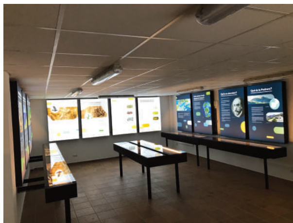
Figura 6: vista general de la sala d'exposició sobre els jaciments de les Calcàries litogràfiques al Centre d'Interpretació del Montsec de Meià.

Val la pena fer un incís en aquest punt per posar de relleu una problemàtica pròpia d'aquelles àrees rurals de baixa densitat, una realitat demogràfica i socioeconòmica que cada vegada va a més a tot el món. Per fer-nos una idea, agafarem com a marc d'actuació el Geoparc Orígens, que inclou 19 municipis de les