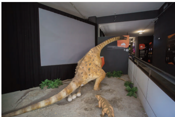
Figura 4: vista del diorama principal de Dinosfera, amb la reconstrucció del titanosaure fent la posta i una reconstrucció el cocodril notosúquid Ogresuchusfuratus al seu costat.