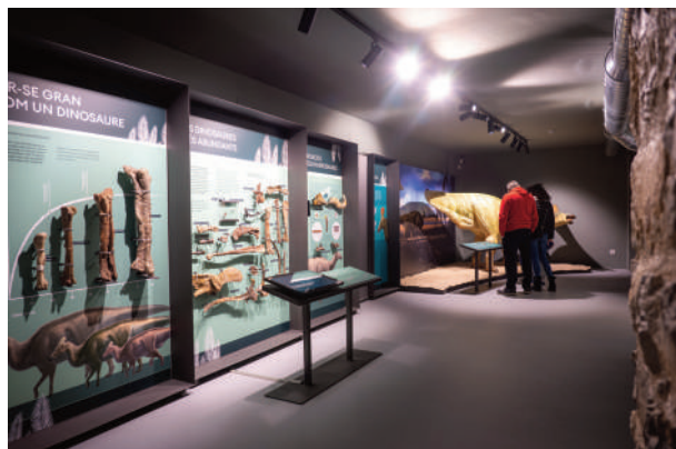
Figura 5: vista parcial de la sala de paleontologia del Museu de la Conca Dellà.

La renovació del museu es fa en dues fases, en la primera s'actua sobre un edifici que es troba davant del museu, l'anomenada casa "Cal Serra". Les obres consisteixen en buidar l'interior de l'edifici per refer els treballs dels pisos a la mateixa alçada que els de les sales d'exposició del MCD, reforçar i rehabilitar la façana i fer la teulada nova. Aquesta primera fase s'acaba l'any 2019 i, a continuació, ja es posa a concurs la segona fase que inclou la construcció d'una passarel·la metàl·lica que uneix els dos edificis, l'elevació de part de la teulada del MCD, la construcció de les oficines, sala de reserva i laboratori de preparació i la producció de la museografia i una nova botiga.