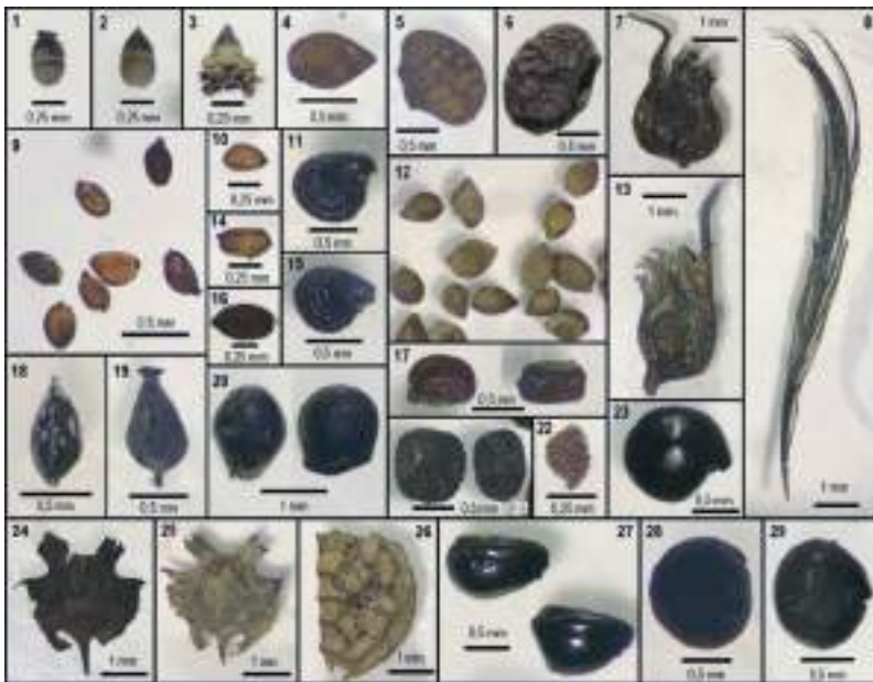
Figura 2. Macrorestos vegetales. 1-3. Azolla filiculoides (Salviniaceae; megasporas); 4, 12. Aphanes parodii (Rosaceae; semillas); 5, 6. Lepidium didymum (Brassicaceae; frutos); 7, 13. No identificados (cálices); 8. Poaceae sp. (restos vegetativos); 9, 10, 14. Juncus pallescens (Juncaceae; semillas); 11, 15. Portulaca papulosa (Portulacaceae; semillas); 16. Juncus sp. A (Juncaceae; semilla); 17. Eragrostis mexicana (Poaceae; semillas); 18. Cyperus reflexus (Cyperaceae; aquenio); 19. Cyperus eragrostis (Cyperaceae; aquenio); 20. Acanthocalycium spiniflorum (Cactaceae; semilla); 21. Eleusine tristachya (Poaceae; semillas); 22. Characeae (oospora); 23. Chenopodium sp. A (Amaranthaceae; semilla); 24, 25. Soliva sessilis (Asteraceae; aquenios); 26. cf. Malvaceae (frutos); 27. Amaranthus sp. B (Amaranthaceae; semillas); 28, 29. Amaranthus sp. A (Amaranthaceae; semillas).