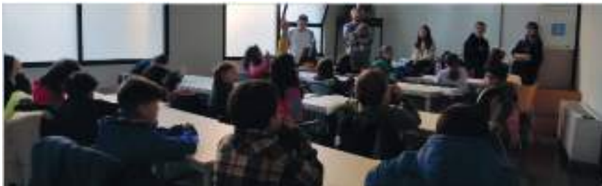
Figura 3. Fotografía de la explicación de la tercera dinámica.

Tras una breve explicación sobre la fauna de Ediacara y una introducción a la Explosión Cámbrica (Fig. 3) se dio comienzo a un juego en el que los participantes encarnaban animales cámbricos mediante gestos, siguiendo la jerarquía: Anomalocaris > Trilobites > Bivalvo. Todos comenzaban siendo bivalvos, y cuando dentro de un continuo movimiento se encontraban dos participantes con el mismo animal, estos se batían a un duelo de "piedra, papel o tijera". El ganador ascendía al siguiente animal en la jerarquía mientras que el perdedor descendía, simbolizando los cambios y desarrollos faunísticos del Cámbrico.