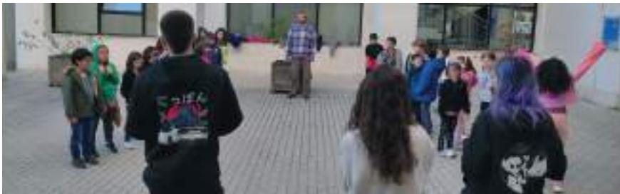
Figura 1. Fotografía de la ejecución de la primera dinámica.

El grupo de participantes se dividió en dos equipos (Fig. 1) y realizaron una carrera de relevos para adquirir todos los fragmentos de papel en los que se dividían las definiciones de Paleontología y Tafonomía, respectivamente. Cada equipo compitió para ser el primero en conseguir los trozos y formar correctamente las definiciones, que fueron expuestas en alto.