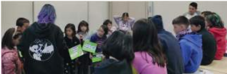
Figura 2. Fotografía de la ejecución de la segunda dinámica.

Los participantes de 6 a 8 años se situaron en fila ordenados según su fecha de nacimiento, representando así la escala geológica temporal. A continuación, se fueron colgando al cuello, dependiendo de su posición, diversos carteles que simbolizaban eventos biológicos importantes a modo de pista. El resto de participantes tuvieron que asignar el resto de carteles (Fig. 2) donde pensaban que era su lugar usando como ayuda una tabla cronoestratigráfica. Después, se corrigieron los posibles errores de colocación y se revelaron las cronologías aproximadas de cada evento. Esta actividad permite apreciar de manera proporcional la escala de tiempo geológica, y cómo la mayoría de los hitos se concentran al final de la fila, correspondiente con el eón Fanerozoico.