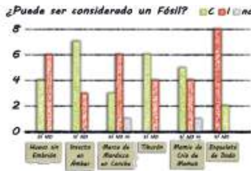
Figura 5. Resultados del cuestionario previo sobre casos concretos de la tabla de posibles fósiles. C : correcto, I : incorrecto, nc : no contesta.

En cuanto a la definición dada como respuesta inicialmente para la palabra fósil, en un 60% de los casos los participantes consideraron únicamente los restos óseos como posibilidad. Esto les llevó a cometer errores en la tabla de clasificación de fósiles, donde la moda fue excluir como tal a todos los icnofósiles, al huevo sin embrión desarrollado y a la momia de cría de mamut; a la par que incluir al esqueleto del dodo en el 80% de los casos. El 40% de los participantes conocía la dificultad de fosilización del cartílago, pero el dato les condujo erróneamente a creer que un tiburón no podría fosilizar en ninguna circunstancia (Fig. 5). Tras la dinámica de las tarjetas, los resultados globales de la definición de fósil también demuestran una mejoría de su corrección en el cuestionario posterior (Fig. 4).