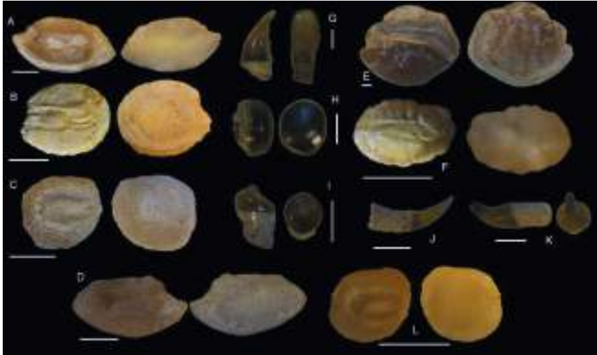
Figura 2. Osteíctios: A) Otolito sagitta de Cepola macrophthalmalma . B) Otolito sagitta de Diaphus sp. C) Otolito sagitta de Microchirus cf. M. ocellatus . D) Otolito sagitta de Echeilus myrus . E) Otolito sagitta de Pomadasys incisus . F) Otolito sagitta de Ophidion cf. O. tuseti . G) Diente incisivo de Diplodus sp. H) Diente de Sparus neogenus . I) Diente de la familia Sparidae. J) Diente de Dentex sp. K) Diente de la familia Sparidae. L) Otolito sagitta de Quenselia cornuta . Escala 1 mm.

Condricíctios: Los condricíctios son mucho más escasos (Tabla 2), ya que sólo se han hallado 6 dientes, algunos de ellos en mal estado de conservación. Todos pertenecen a rajiformes, entre los que se identificaron 3 dientes de Raja olisiponensis (Jonet, 1968) (Fig. 3).