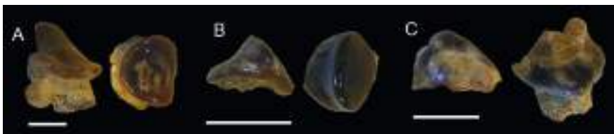
Figura 3: Condricíctios: A)- Diente de Raja olisiponensis (macho). B)- Diente de Raja olisiponensis (hembra). C)- Diente de Rhinobatidae indeterminado. Escala 1 mm.