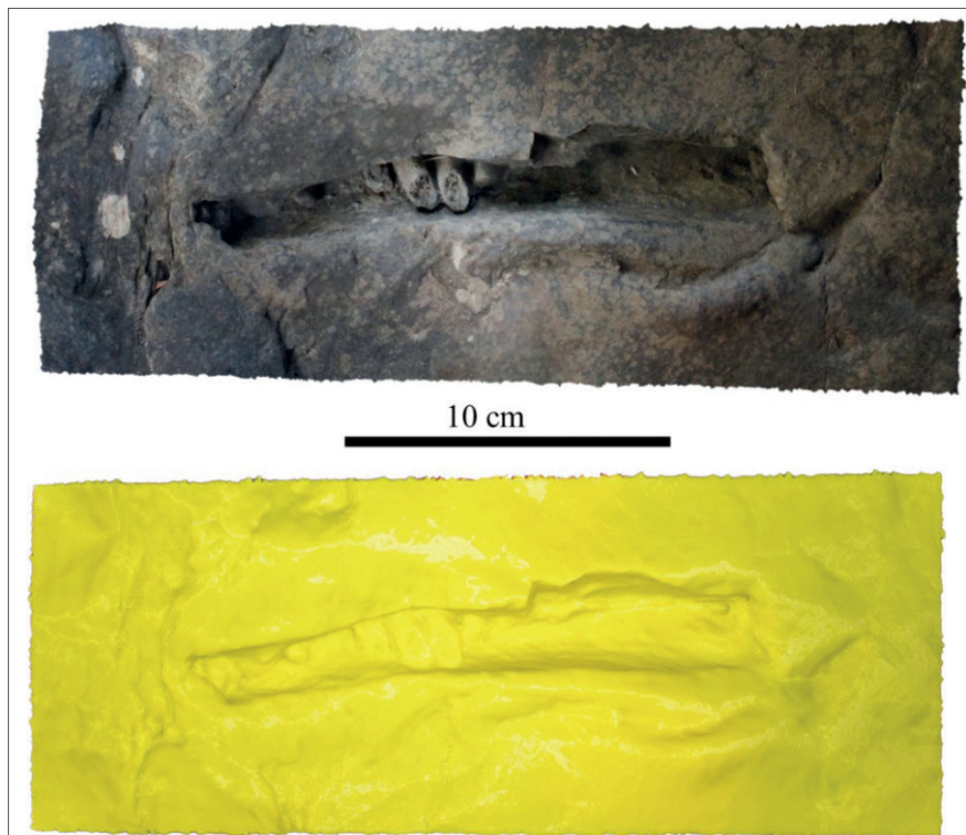
Figura 2. Ortoimagen generada a partir del modelo 3D y réplica impresa del molde de la mandíbula

cual es usado por el programa para determinar la orientación relativa de las cámaras en el momento que se realizó la fotografía. Se tomaron fotografías a diferentes alturas respecto a la pieza, intentando solapar todas las perspectivas posibles. El siguiente paso consistió en la obtención de una nube de puntos, generada a partir del cálculo de coordenadas a partir de los píxeles coincidentes en cada cámara. Esto permitió tener todas las fotografías alineadas y generar la nube inicial de puntos (Elorriaga et al. , 2018). El siguiente paso fue la creación de una nube densa a partir de la nube de puntos inicial. Para intentar producir un modelo lo más acorde a la realidad posible, se realizaron todos los procesos a máxima calidad, lo que se tradujo en una nube densa de un total de 19.493.710 puntos. Tras este proceso, se generó el mallado sobre la zona donde se encuentra el molde de mandíbula, y se realizó el escalado métrico a partir de las escalas georreferenciadas sobre el terreno, que permitió que el modelo sea acorde a la realidad con un margen de error de 1 mm. El último paso consistió en la generación de textura, usando las fotografías para ajustar el mallado con los píxeles de color. Después se creó un modelo de elevación digital en base al modelo para poder generar ortoimágenes de la muestra. Una vez obtenido el modelo, se realizó una réplica en 3D haciendo uso de una impresora Bambulab P1S , de filamento PLA Tought, marca Bambulab .